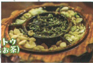
ラペットウ (食べるお茶)