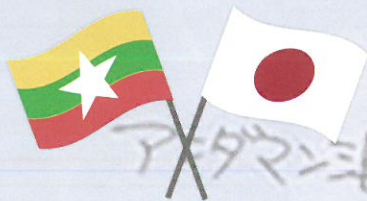
ミャンマーの国旗